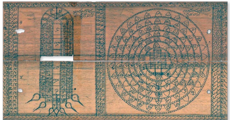
Bija-Mantras und Yantras aus dem Parameshwari Palmblatt-Manuskript, geschrieben in altem Telugu.

Weitere klinische Studien mit modernen Qualitätsstandards sind also angesichts der vielversprechenden Ergebnisse bei gesunden Praktizierenden nötig. Da säkulare Meditationstechniken aus spirituellen Traditionen entstanden sind, ist es möglich, dass einige der positiven Effekte im spirituellen Kontext verwurzelt sind. Dies ist deswegen relevant, da der überwiegende Teil der bisherigen Forschung eine positive Beziehung zwischen Spiritualität und geistiger und körperlicher Gesundheit zeigen konnte. Bezüglich Mantra-Meditation haben verschiedenen Studien ergeben, dass Techniken mit spirituellem Kontext einen größeren Einfluss auf psychologische, schmerzbezogene und spirituelle Variablen zeigte als die säkularen Varianten.