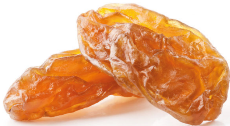
Abb. 3 Rosinenübung: Die schrittweise sensorische Erfahrung unterstützt den achtsamen Umgang mit Nahrungsmitteln.

Sehr wahrscheinlich werden regelmäßig beim Fasten diese 5 Phasen psychologisch durchlaufen und gehen ineinander über. Die einzelnen psychologischen Mechanismen sind individuell unterschiedlich intensiv wirksam (Psychoedukation, Des-Identifikation,