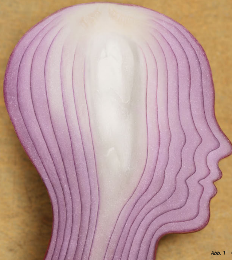
Abb. 1